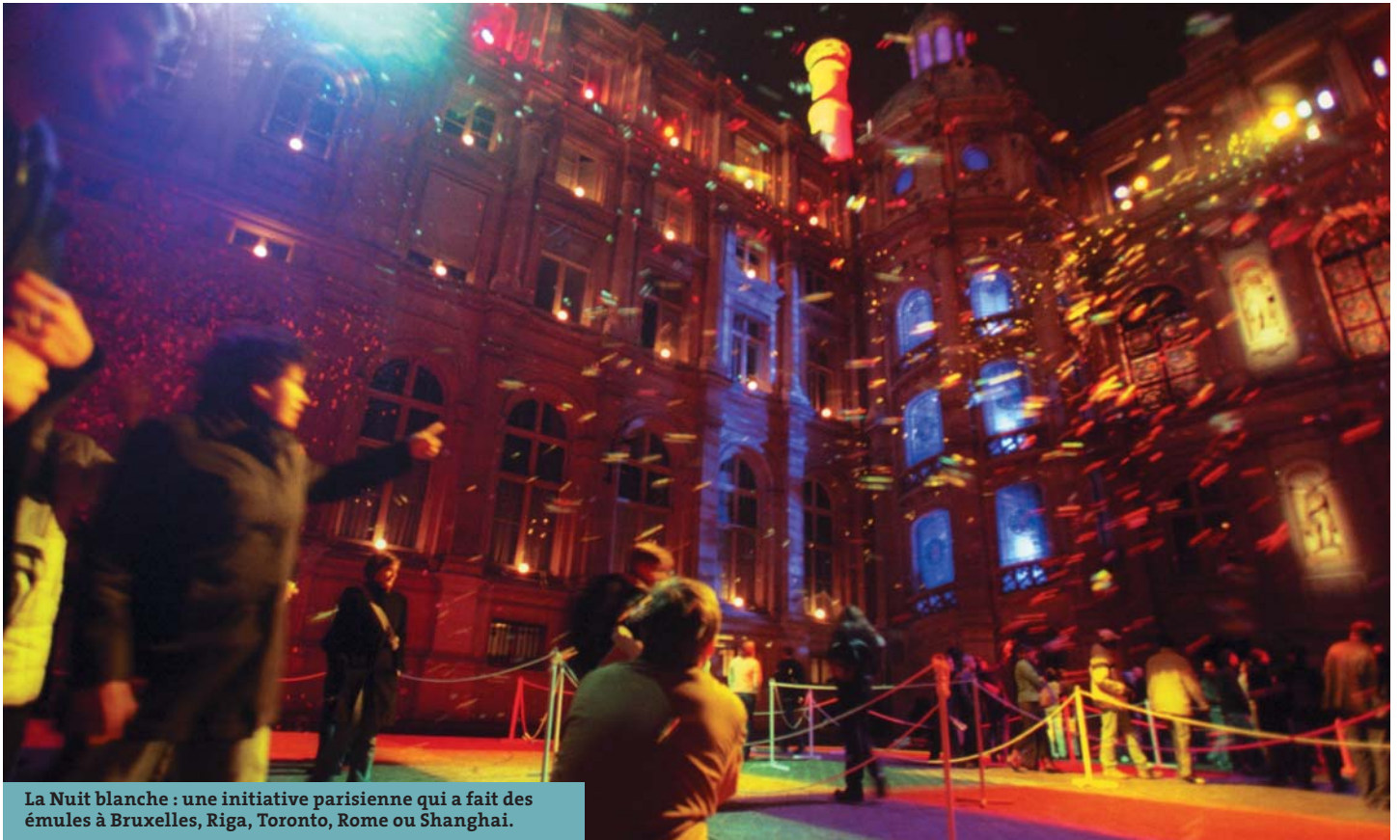
La Nuit blanche : une initiative parisienne qui a fait des émules à Bruxelles, Riga, Toronto, Rome ou Shanghai.

indépendants et met à disposition des locaux vacants en pied d'immeuble.