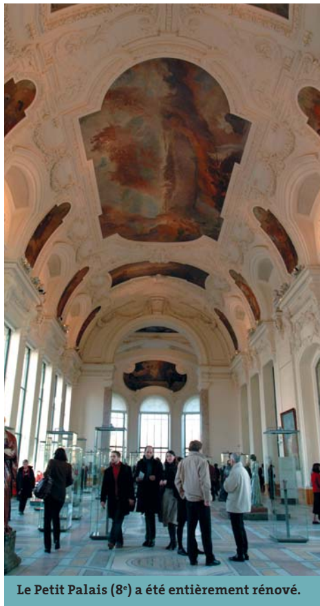
Le Petit Palais (8 e ) a été entièrement rénové.

→ Un nouveau rapport au patrimoine. Limitée aux édifices monumentaux et