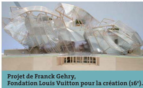
Projet de Franck Gehry, Fondation Louis Vuitton pour la création (16 e ).

Enfin, nous avons noué des dialogues constructifs avec plusieurs collectifs d'artistes squattant des lieux municipaux : « Electron libre », rue de Rivoli, « Paris centre art », rue Saint-Honoré, « L'Entreprise libre », rue René-Boulanger, ou non municipaux comme le Théâtre de Verre, rue de l'Échiquier ou La Générale dans le 19 e . La Ville développe des lieux d'accueil pour ces collectifs, comme au 100, rue de Charenton (12 e ).