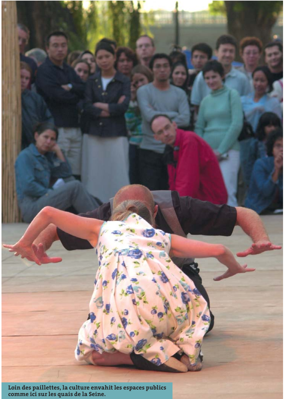
Loin des paillettes, la culture envahit les espaces publics comme ici sur les quais de la Seine.

a été instauré dès 2002 ; leur fréquentation a augmenté de 30 %. Pour les expositions temporaires, la gratuité a été étendue aux enfants jusque 14 ans et des tarifs particuliers sont accordés aux