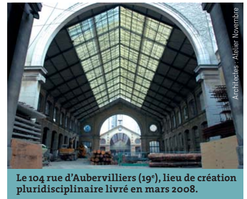
Le 104 rue d'Aubervilliers (19 e ), lieu de création pluridisciplinaire livré en mars 2008.

60 e anniversaire de la Libération de Paris, souvenir de la déportation : Paris assume son devoir de mémoire